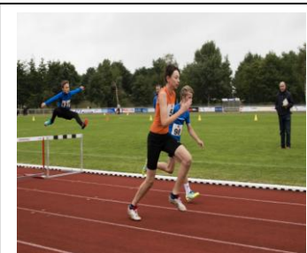
Im Hürdenlauf kann noch an der Technik geübt werden.